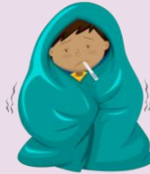
Fiebre o escalofríos

Debido a que la salud y la seguridad de los estudiantes y el personal es una prioridad, las escuelas limitarán a los visitantes externos. Sólo se permitirá en el edificio a los directamente involucrados en el proceso educativo. Los miembros de la familia no podrán almorzar con su hijo, ser voluntarios en el salón de clases ni asistir a eventos. Las escuelas compartirán otras maneras de involucrar a las familias.