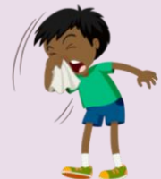
Congestión o mucosidad nasal