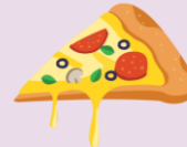
Nueva pérdida del sabor o del olfato