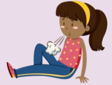
Falta de Aliento o dificultad para respirar